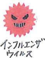
インフルエンザウイルス